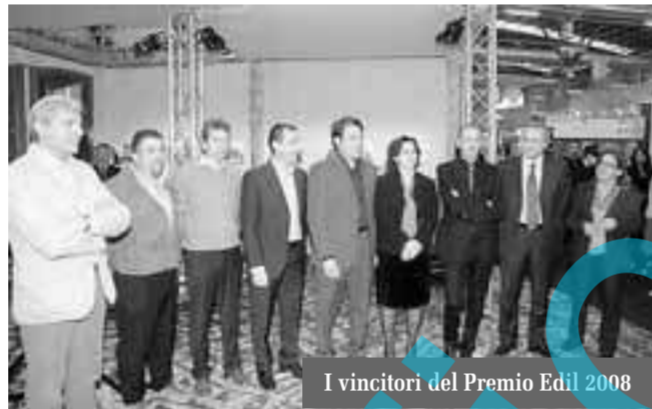
I vincitori del Premio Edil 2008

L'edilizia, a Bergamo, va a braccetto con l'innovazione tecnologica: costruzioni realizzate con un occhio di riguardo al risparmio energetico, caminetti ad alto rendimento e gru digitali. Sono solo alcuni degli esempi di edilizia innovativa presentati alla fiera Edil 2008 e applauditi ieri al Premio per l'innovazione tecnologica in campo edile. Un riconoscimento che ogni anno ha come obiettivo quello di mettere in evidenza gli elementi innovativi che rendono forte l'edilizia made in Bergamo e che quest'anno è stato assegnato alla «Nava G. srl» per gli elementi introdotti nella costruzione del complesso immobiliare «Abitare meglio», a Brembate Sopra. Trentotto le proposte per-